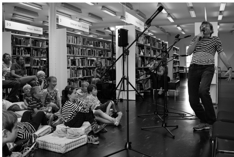
Flipper Flipperchaschte – CD Taufe in der Kornhausbibliothek am 23. August 2015